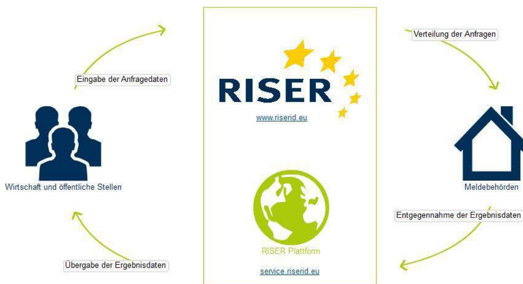
Abb. 1: Überblick über den RISER-Dienst

Die nachfolgende Abbildung gibt einen Überblick über den RISER-Dienst: